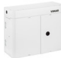
03132 - CSOE modulo di distribuzione