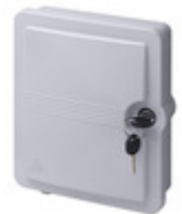
03134 - STOM - Terminale di testa