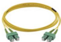
03113.SC - Cordone mono 9/125 SC/SC OS2 dplx 2m