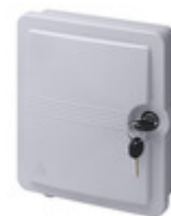
03134 - STOM - Terminale di testa