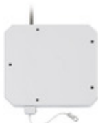
01825 - By-alarm Plus contatto a fune