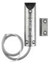
01824 - By-alarm Plus cont. magn. portoni garage