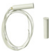
01820 - By-alarm Plus cont. magn. plastico incasso