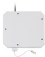
01825 - By-alarm Plus contatto a fune