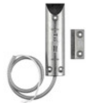
01824 - By-alarm Plus cont. magn. portoni garage