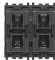
01582 - Comando KNX 4 pulsanti+tappar.lamelle 2M