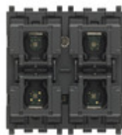
01581 - Comando KNX 4 pulsanti + attuatore 2M