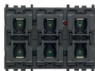
01588 - Comando KNX Secure 6 pulsanti 3M