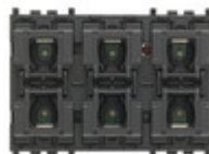
01587 - Comando KNX 6 pulsanti+tappar.lamelle 3M