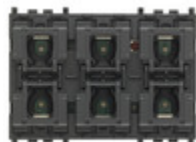
01586 - Comando KNX 6 pulsanti + attuatore 3M