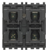
01580 - Comando KNX 4 pulsanti 2M