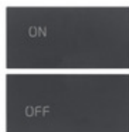
20752.1 - Due mezzi tasti 2M simboli ON/OFF grigio