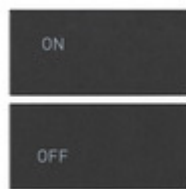
19752.1 - Due mezzi tasti 2M simboli ON/OFF grigio