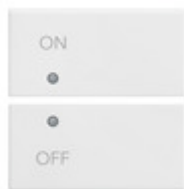
14752.1 - Due mezzi tasti 2M simboli ON/OFF bianco