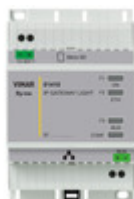
01410 - Gateway Light domotica By-me