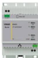
01411 - Gateway domotica By-me