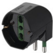
00305 - Adattatore sfalsato S17+univ. 90° nero