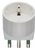
00303.B - Adattatore S17 + P30 bianco