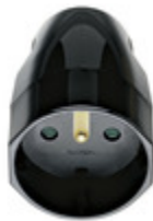
00251 - Presa 2P+T 16A francese assiale nero