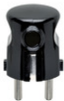
00241 - Spina 2P+T 16A S31 90° nero