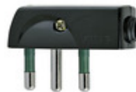
00207 - Spina 2P+T 16A SPA17 90° nero