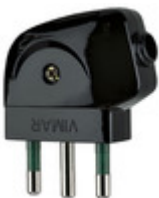
00212 - Spina 2P+T 16A S17 90° nero