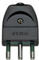
00202 - Spina 2P+T 16A S17 assiale nero