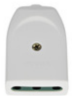
00222.B - Presa 2P+T 16A P17 assiale bianco