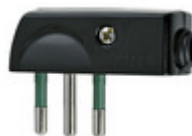
00206 - Spina 2P+T 10A SPA11 90° nero