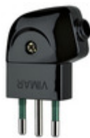
00211 - Spina 2P+T 10A S11 90° nero