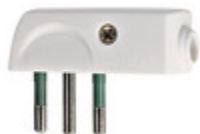
00206.B - Spina 2P+T 10A SPA11 90° bianco