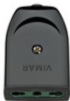
00223 - Presa 2P+T 16A P17/11 assiale nero