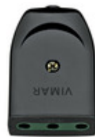
00222 - Presa 2P+T 16A P17 assiale nero