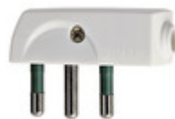
00207.B - Spina 2P+T 16A SPA17 90° bianco