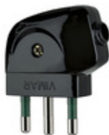
00212 - Spina 2P+T 16A S17 90° nero