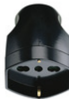
00225 - Presa 2P+T 16A universale assiale nero