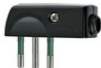
00206 - Spina 2P+T 10A SPA11 90° nero