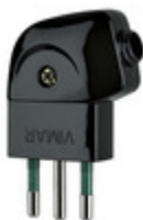
00211 - Spina 2P+T 10A S11 90° nero