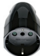
00224 - Presa 2P+T 16A P30 assiale nero