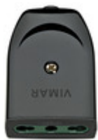
00223 - Presa 2P+T 16A P17/11 assiale nero