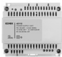
40110 - Alimentatore 2F+ 100-240V 1 OUT 1,6A