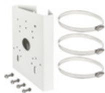
46917.002.01 - Staffa palo per Bullet e SpeedDome IP