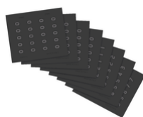
21846 - 8 fogli etichette numeri illuminabili