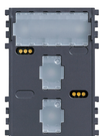
21457.1 - Lettore transponder verticale est.KNX NR