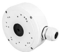
46922.041 - Staffa contatti per telecamera IP