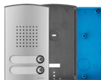
40142 - Placca audio bifamiliare