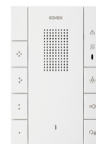
40547 - Citofono vivavoce 2F+ Voxie 7 puls. b.co