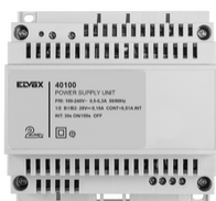
40100 - Aliment. Kit Cito m/b 2F+ 100-240V 0,6A