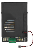
40131 - Unità audio 2F+ per placche 40141/40142