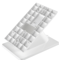
40598 - Base da tavolo Voxie bianco