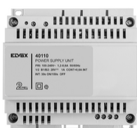
40110 - Alimentatore 2F+ 100-240V 1 OUT 1,6A