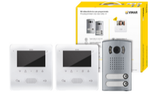
7558/E2 - Kit video 2F+ bifam. Tab 4.3 vivavoce