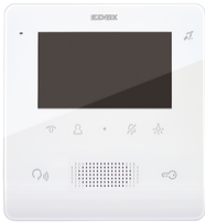
7558 - Videocitofono TabFree4,3 2F+vivav.bianco