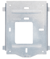
R986 - Staffa da parete metallica per 7558 7559