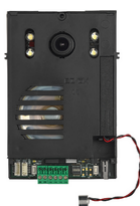
40135 - Unità 2F+ audio/video