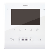
7558 - Videocitofono TabFree4,3 2F+vivav.bianco