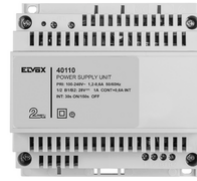
40110 - Alimentatore 2F+ 100-240V 1 OUT 1,6A