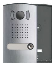
40151 - Placca audio/video monofamiliare