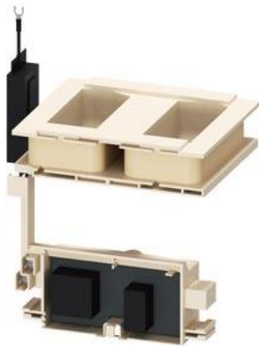
Bobina magnetica con elettronica di inserimento per contattore 3TF6844-.C..., AC 110 ... 132 V 50/60 Hz