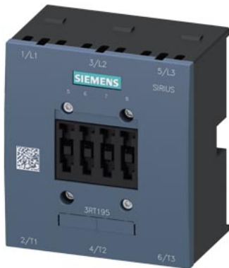
Camera spegningarco per 3RT1456