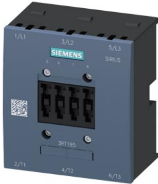
Camera spegningarco per 3RT1054