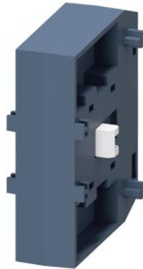
interblocco meccanico per 3RT135, 3RT136, 3RT137