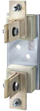
Base di fusibili NH gr. 4, a 1 polo 1250 A, 690V attacco piatto