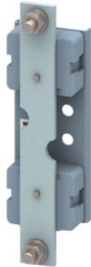
Neutral terminal base ceramic Sz. 2 400A 690V