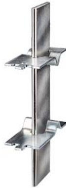
coltelli sezionatori NH gr. 4 A