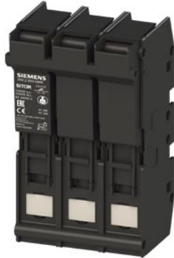
Portafusibili SITOR 22x 127 63A 1500 V AC/DC 1000 V a 3 poli