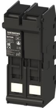
Portafusibili SITOR 22x 127 63A 1500 V AC/DC 1000 V a 2 poli