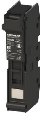
Portafusibili SITOR 22x 127 63A 1500 V AC/DC 1000 V a 1 polo