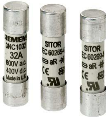
SITOR- cartuccia fusibile cilindrica, 14x51 mm, 32 A, gR, Un AC: 690 V, Un DC: 600 V