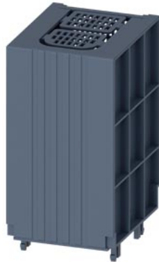
calotta coprimorsetti SENTRON per 3KF4