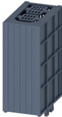
calotta coprimorsetti SENTRON per 3KF2