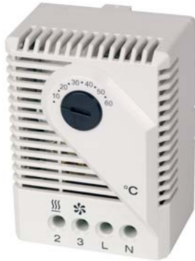
termostato meccanico contatto CO-20 ... 30 °C FZK011