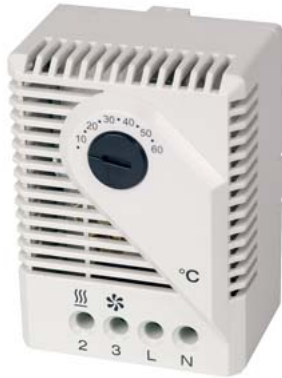
termostato mecc. contatto CO 10 ... 60 °C