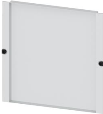
copertura di scomparto ALPHA NF profondità 35 mm A=600, La=600mm