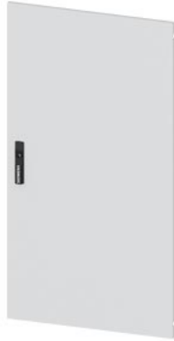
ALPHA 630 Universal, porta IP43, lamiera, RAL7035, A=1200, La=240