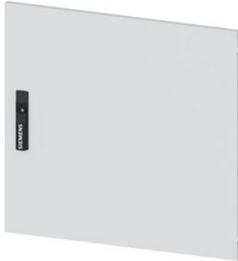
ALPHA 125 Universal, porta IP43, lamiera RAL7035, A=600, B=600