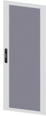
ALPHA 630 Universal, porta IP43, IP55, trasparente (esecuzione semplice) RAL7035, A=1600, B=600