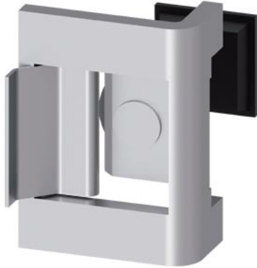
ALPHA 630 NF cerniera per copertura di sezione