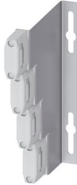
Stab Universal supporto porta-sbarre a 4 poli graduato, 15x 5/20x 5/30x 5 mm