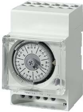
Orologio interruttore al quarzo settimana 1 contatto CO 230V/50-60Hz 3TE