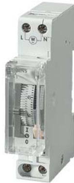
Orologio interruttore al quarzo Tag 1NO 230V/50-60Hz 1TE