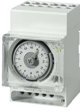
Orologio interruttore sincrono Tag 1 contatto CO 230V/50Hz 3TE