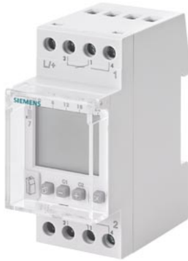
Orologio interruttore settimanale Profi Digitale 24V 16A a 2 canali 2TE