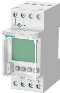
Orologio interruttore settimanale Profi Digitale 24V 16A a 1 canale 2TE