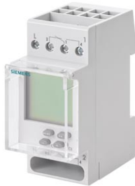
Orologio interruttore settimanale TOP Digitale 230V 16A a 2 canali 2TE