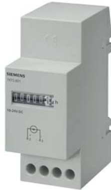
contatore delle ore di esercizio, meccanico, DC 10 ... 24V