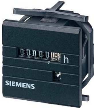
Contaore 48x 48 mm AC 230V 60Hz senza mostrina 55x 55 mm